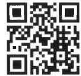
神奈川県病院協会 一般演題募集ページ